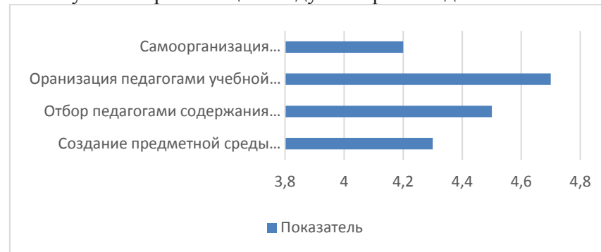
Результаты реализации модуля «Урочная деятельность»